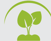
PROTECCIÓN DE PLANTAS

La gestión de nutritivos es uno de los puntos cardinales de la producción de alimentos de alta calidad. Por un lado, porque el uso de los nutritivos es un gasto para el agricultor y por otro, esta tecnología permite asegurar permanentemente nutritivos y así alcanzar un óptimo desarrollo de las plantas. El sistema AgroSense es capaz de medir la capacidad conductiva de la energía solar y del suelo o sustrato que pueden aprovechar las plantas, permitiendo así el óptimo aprovechamiento de los nutritivos.